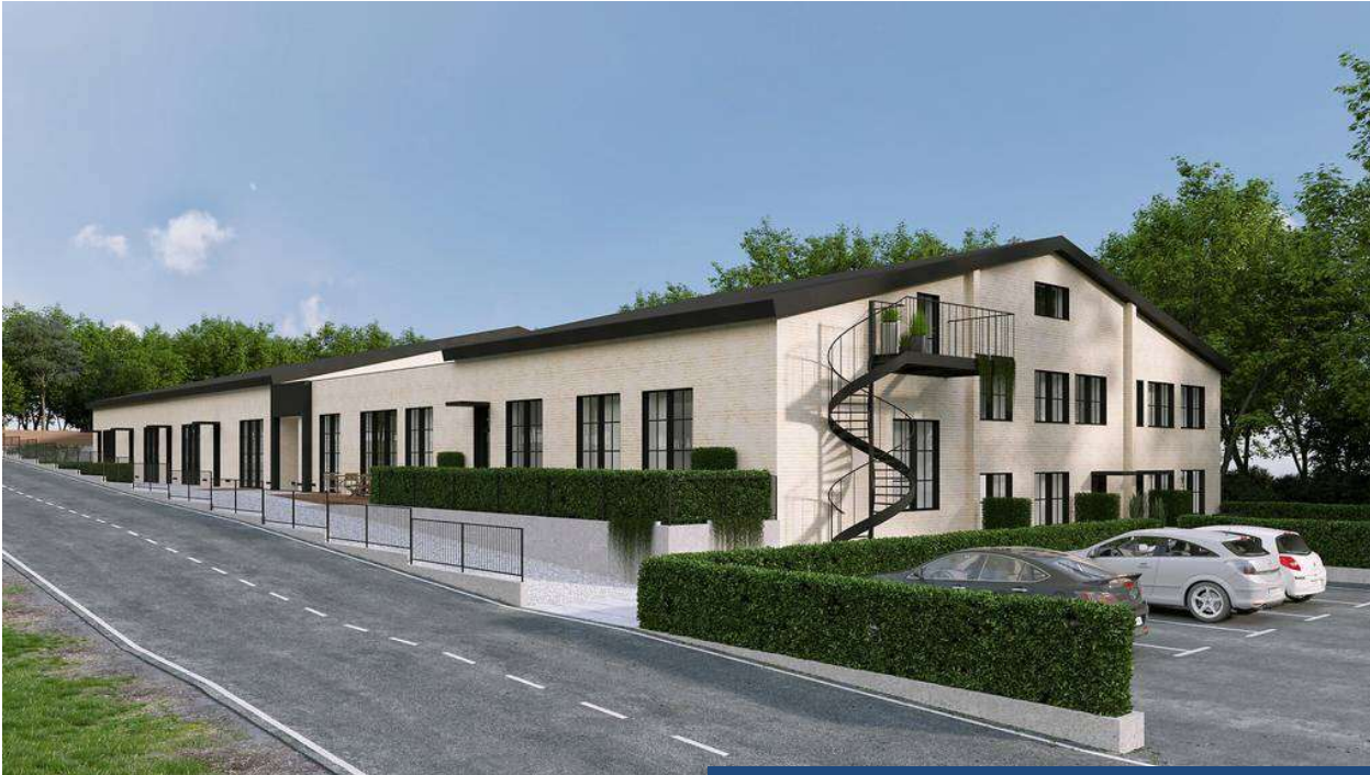
Så här är det tänkt att Offasson huset ska se ut efter renoveringen