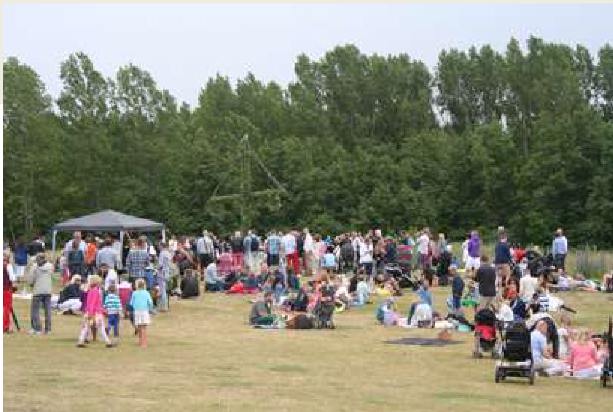
Tradionellt midsommarfirande i Käglinge naturområde.

Käglingedagen och Pålssondagen arrangeras alltid en söndag i september. Tidigare på dagen arrangeras Käglingedagen nere vid Grodans hus och därefter tar Pålssondagen firande sin början uppe i Pålssonhuset. Denna dag hälsar vi alla välkomna till aktiviteter såsom Ansiktsmålning, Knattelopp, Ponnyridning, Utställning, Barnloppis, Lotteriförsäljning, Tipsrundor, Godisregn, Fikaförsäljning, Svampurer, Besök av utryckningsfordon, Studieförbundet, Scouterna, Hintons Golfklubb, Pärfförrådet