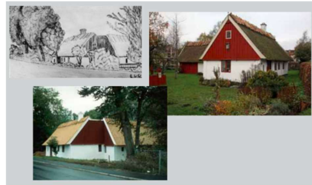
Ett ”förfodat”, d.v.s. delvis förnyat, fönster åt gårdssidan 1986.

Linoljeprodukter baserade på gamla, mycket väl beprövade metoder hjälper nu fransmännen att med långsiktighet hålla nere slottsunderhållets kostnader. Idéerna fick också ta plats vid FN:s miljökonferens i Paris.