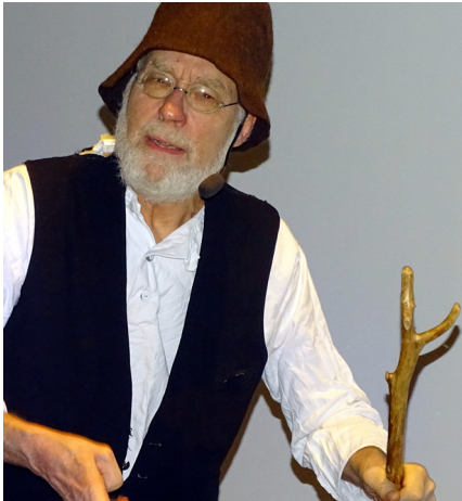
Hänt i gångna tider

Det var sista gången för hösten 2019 onsdagen den 27 november. Det var också sista gången av berättarkvällarnas första fem år som gått till ända med trogen publik, denna gången 84 personer. Under åren har 3970 besökare räknats in till 57 berättarkvällar. Berättarna har varit många, 104 med mycket varierade ämnen. Resuméer finns på webben kaglinge.com under Nätverket Oxie Byar. Programmet för våren 2020 är lagt med start den 15 januari. Vi kallar det "jubileumsprogram".