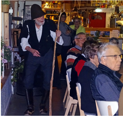
Festligt, fullsatt (nästan)