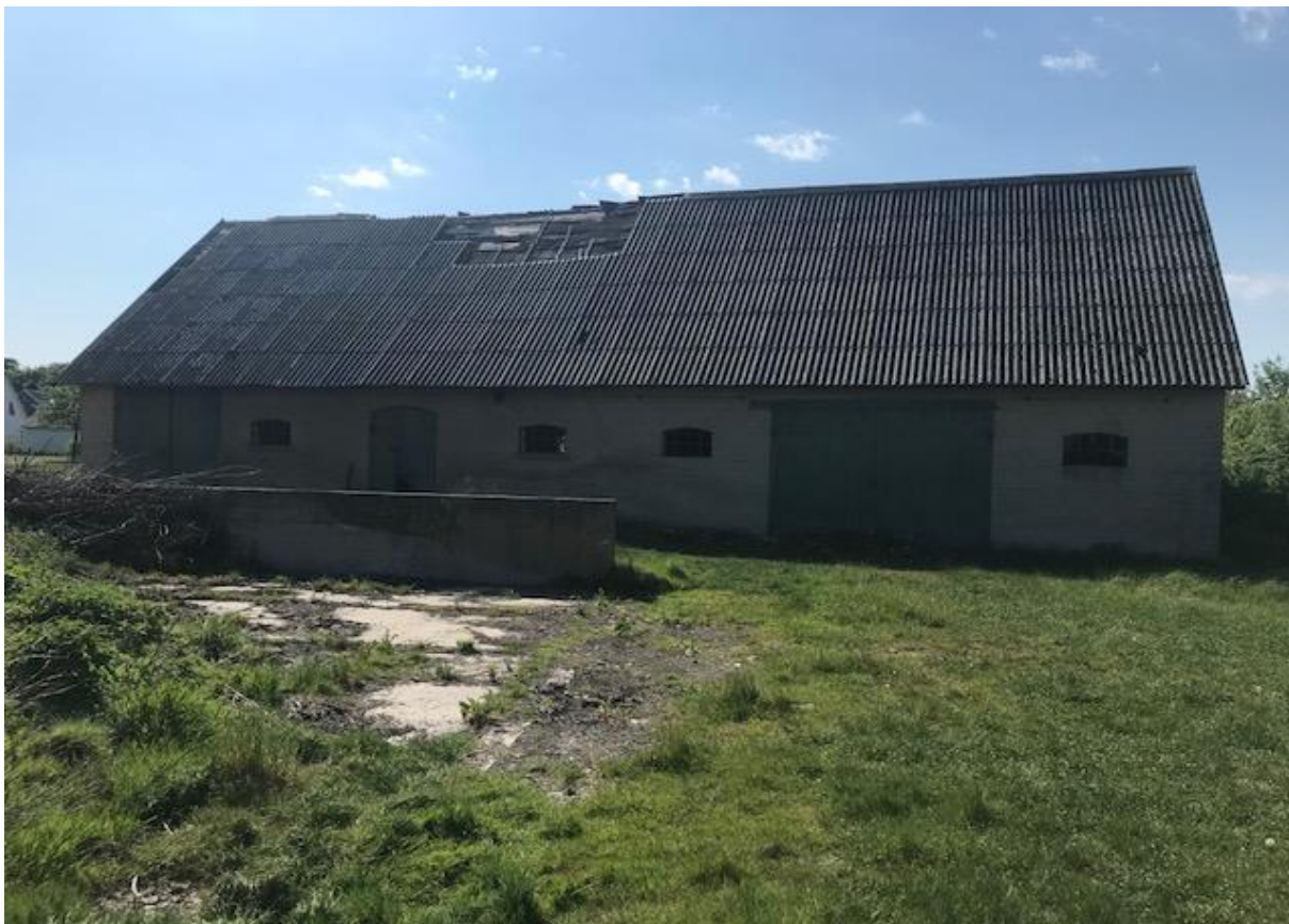
Bild ovan: Fristående lada i väster. Bild nedan: Lada som sträcker sig från öst till väst.