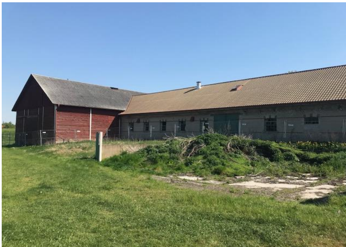
Bild ovan: Lada som ovan, från öst till väst, samt en del av större lada i öster. Nedan: lada i öster.