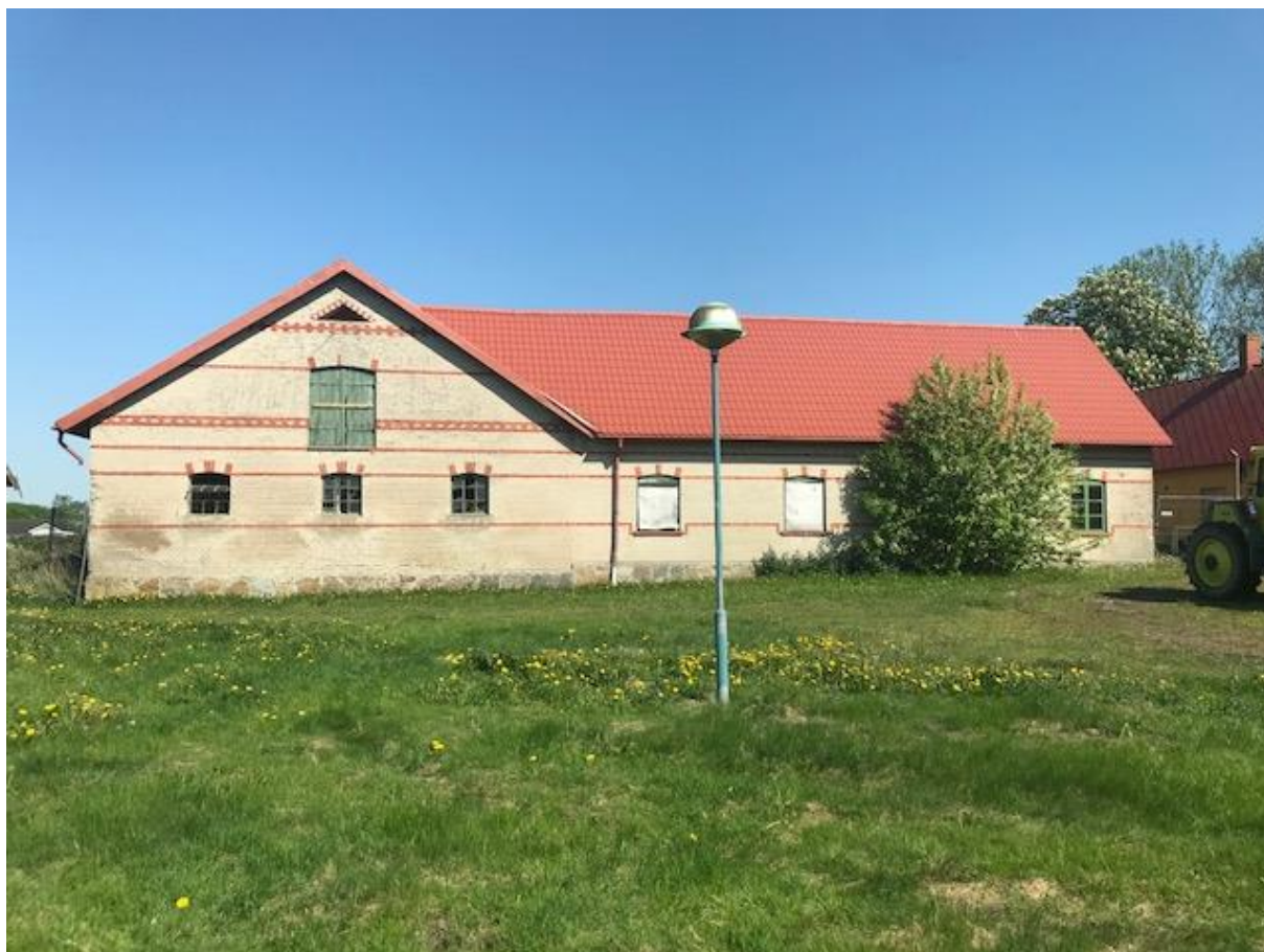
Bild ovan: lada i väster som är sammanhängande med lada från öst till väst.