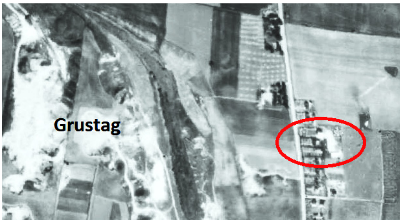
Fabriksområdet mellan landsvägen och Tågebjersvägen som nu rymmer 25 radhuslägenheter.