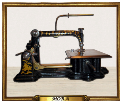
Symaskin från Mora 1865 kunde köpas för 130-150 kronor, vilket idag skulle vara ca 9000 kronor.