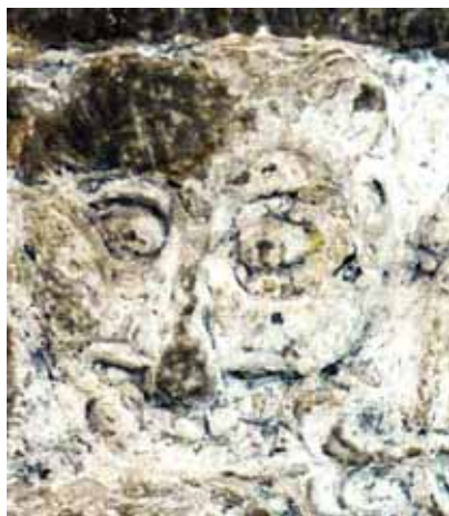
Oxiemästarens signatur, lejonet och vindruvor: Jesus och nattvarden på Oxies dopfunt.