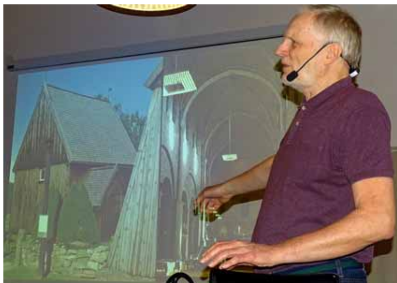
Sven berättade om både små kyrkor (Hedared i Västergötland) och stora