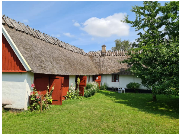
Pålssonhuset restaurerades 1985-1987