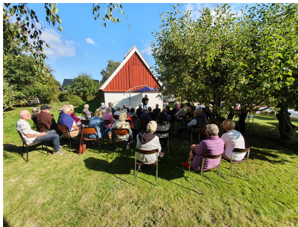
I husets trädgård arrangeras många trevliga arrangemang, var med och engagera dig som guide du med!