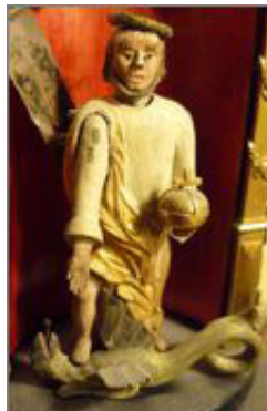
Apostlaverket. Närbilder: Peter Borgelin, DGUV, 9 febr 2011. Lägg märke till att Jesus trampar på draken (ormen). Beakta uppgifterna om apostlaverkets mått, det är miniatyrarbeten.