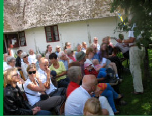
Den stora släktföreningen Bååth höll träff vid Pålssonhuset.