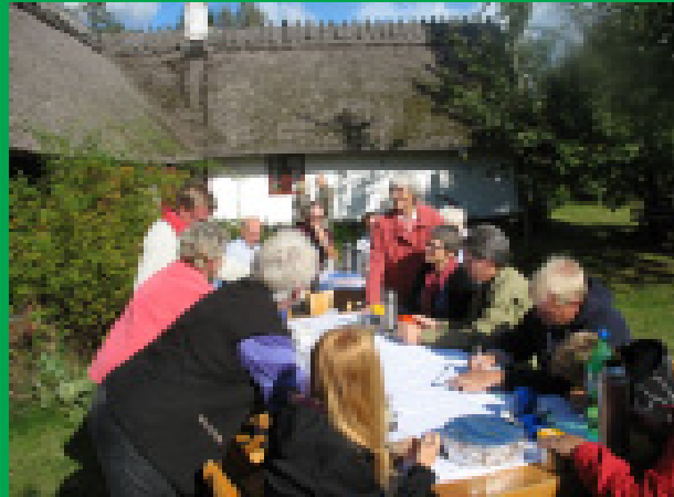
Grannförening från Blankebäck på besök.